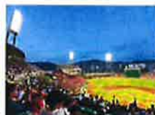
スポーツや観戦で